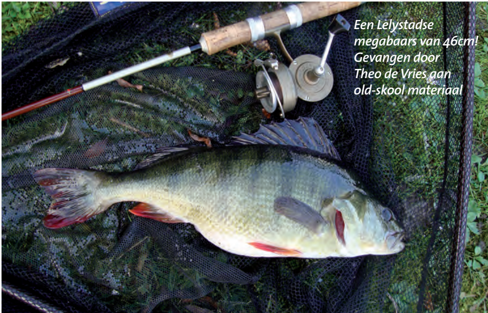
Een Lelystadse megabaars van 46cm! Gevangen door Theo de Vries aan old-skool materiaal

ze er echt elke keer op met brute agressie. Was echt een geweldige dag om niet te vergeten. De diepduikende plugjes staan bij mij al een tijdje in het krijt, en dat zal altijd zo blijven.